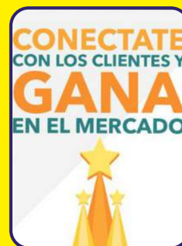
Conéctate con los clientes y gana en el mercado