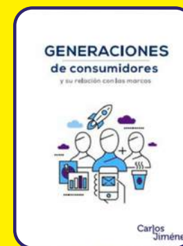
Generaciones de consumidores y su relación con las marcas