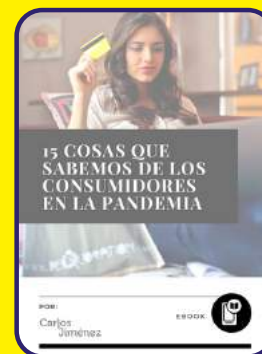
15 cosas que sabemos de los consumidores