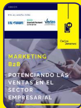
Potenciando las ventas en el sector empresarial