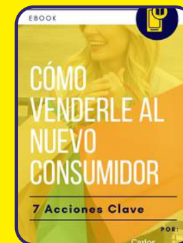
Cómo venderle al nuevo consumidor