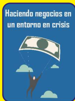
Haciendo negocios en un entorno en crisis