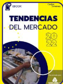
Tendencias del mercado 2022